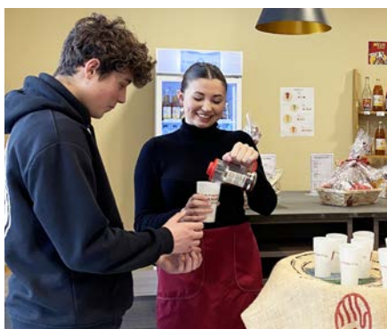
Animer un atelier de dégustation