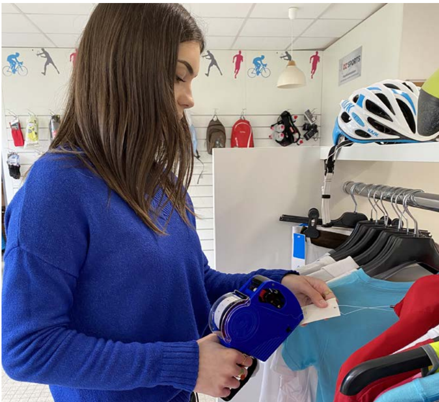
Étiqueter des produits

Un bac pro pour acquérir des compétences en vente. Avec l'option A, vous vous spécialisez dans la gestion d'un espace commercial : accueil et conseil du client, gestion des commandes et des stocks ou encore organisation d'actions de promotion.