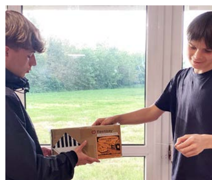
Livrer un produit en click & collect