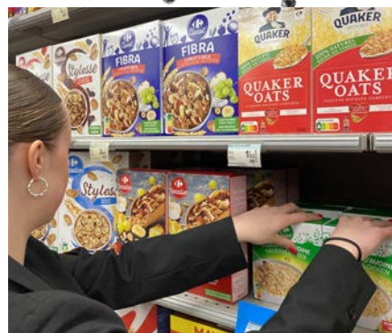
Gérer le facing : bien disposer les produits en rayon