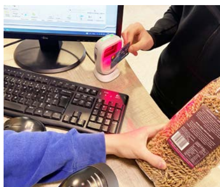
Encaisser un paiement

Objectif : acquérir des compétences pour s'insérer ou poursuivre des études