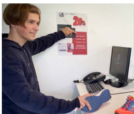
Fidéliser la clientèle

Le diplôme permet de s'insérer dans la vie active. Il permet aussi de poursuivre ses études en BTS avec un bon dossier ou encore en mention complémentaire.