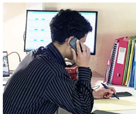
Prospecter par téléphone

Objectif : acquérir des compétences pour s'insérer ou poursuivre des études