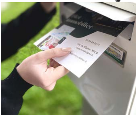
Faire du boîitage