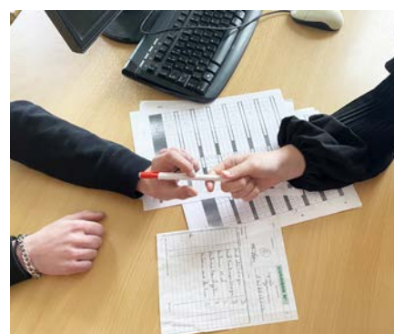
Finaliser la vente