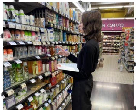
Réaliser un relevé de prix de la concurrence