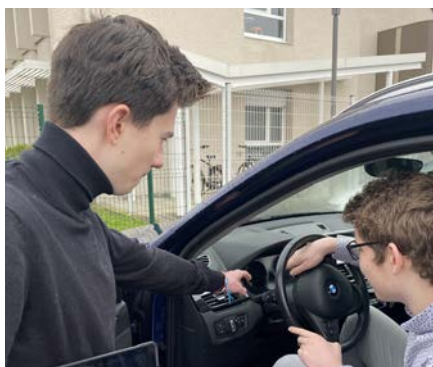
Présenter l'offre commerciale

Le diplôme permet de s'insérer dans la vie active. Il permet aussi de poursuivre ses études en BTS avec un bon dossier ou encore en mention complémentaire.