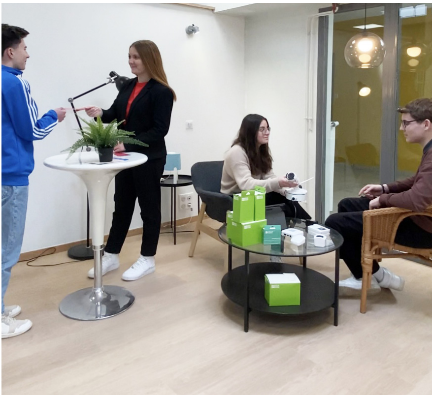
Accueillir et conseiller le client lors d'un show-room