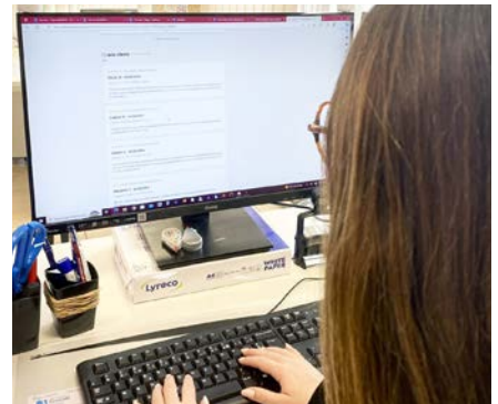
Traiter les avis clients

Lycée professionnel Frédéric Ozanam Cesson-Sévigné - 2023