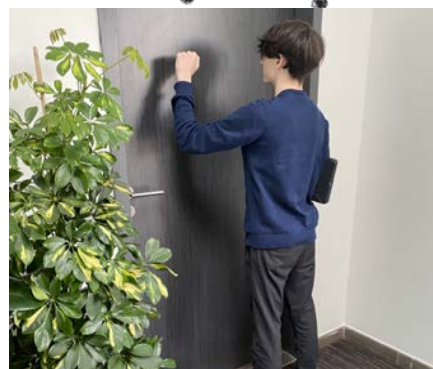
Prospecter en porte-à-porte