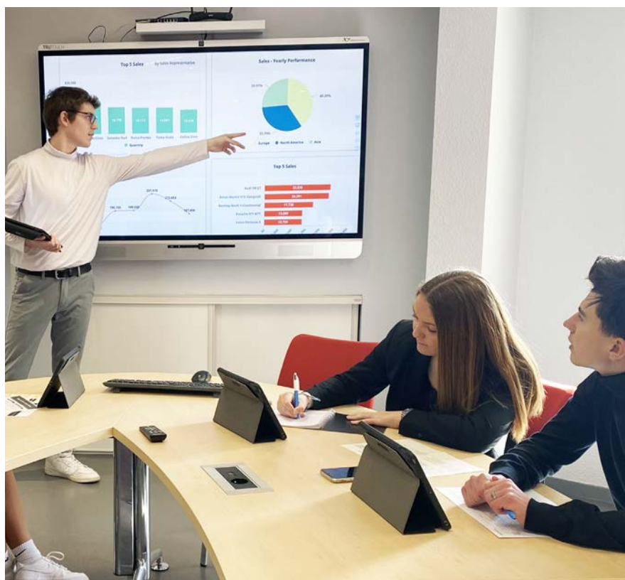
Analyser les résultats de la prospection